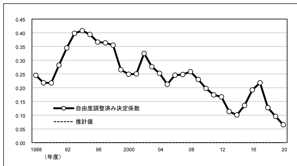
図 A-2 財務情報の有用性の変化

備考：推定値は、重回帰モデルにより推計した自由度調整済みの決定係数を時間で回帰することで算出している。トレンドを示すため、後方3年移動平均としている。