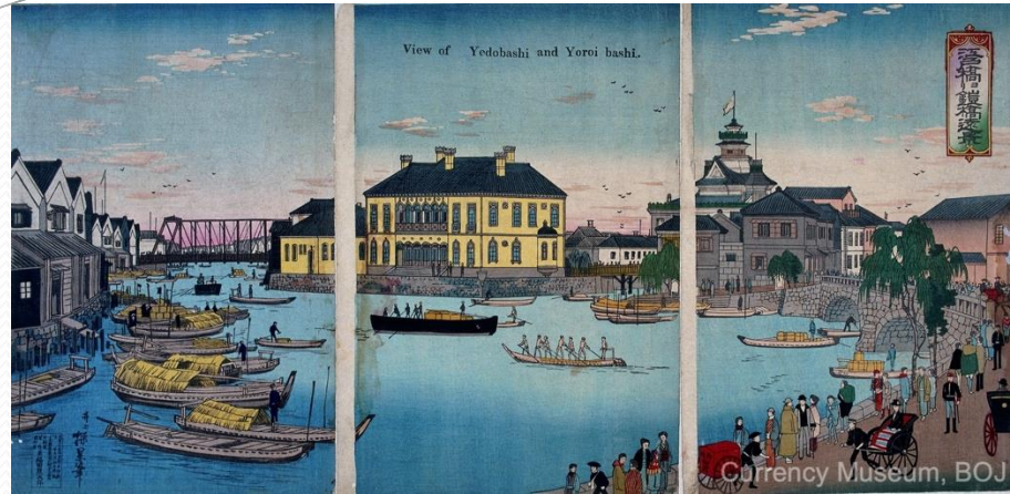
井上探景（安治）「江戸橋ヨリ鐘橋遠景」1888年