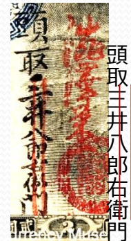
頭取三井の紙幣もあった。