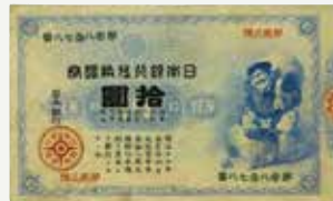
最初的日本银行券“大黑”

对新的货币制度加以完善后,日本引入了统一货币即“日元”,日本银行发行的银行券开始在全国流通。