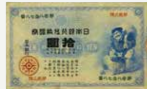
最初的日本银行券“大黑”

对新的货币制度加以完善后,日本引入了统一货币即“日元”,日本银行发行的银行券开始在全国流通。