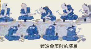
铸造金币时的情景

日本银行总店现在所处的地点在江户时代曾为“金座(金币铸造所)”(当时为本町一丁目)。在这里铸造金币，直至江户时代末期。